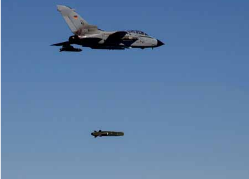
Start des Taurus von einem Tornado