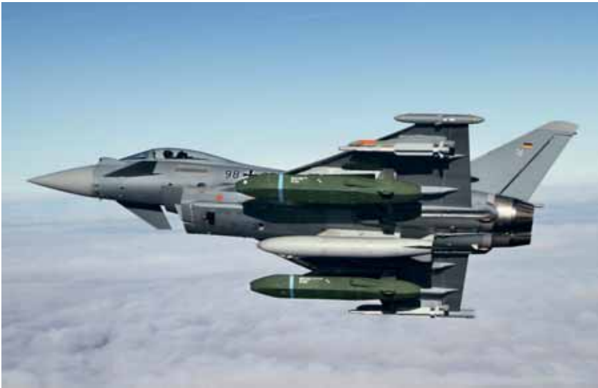
Auch mit dem Eurofighter sind bereits erfolgreiche Trageversuche mit dem rund 1,5 Tonnen schweren Flugkörper gemacht worden.

Lage, in verschiedenen Winkeln, darunter sehr flachen, das Ziel anzufliegen. Die beste Wirkung wird bei einem verbunkerten Ziel jedoch in der Regel erreicht, wenn der Taurus in der letzten Flugphase aufsteigt – das sogenannte Pop-up – und in einem steilen Winkel in den Sturzflug geht.